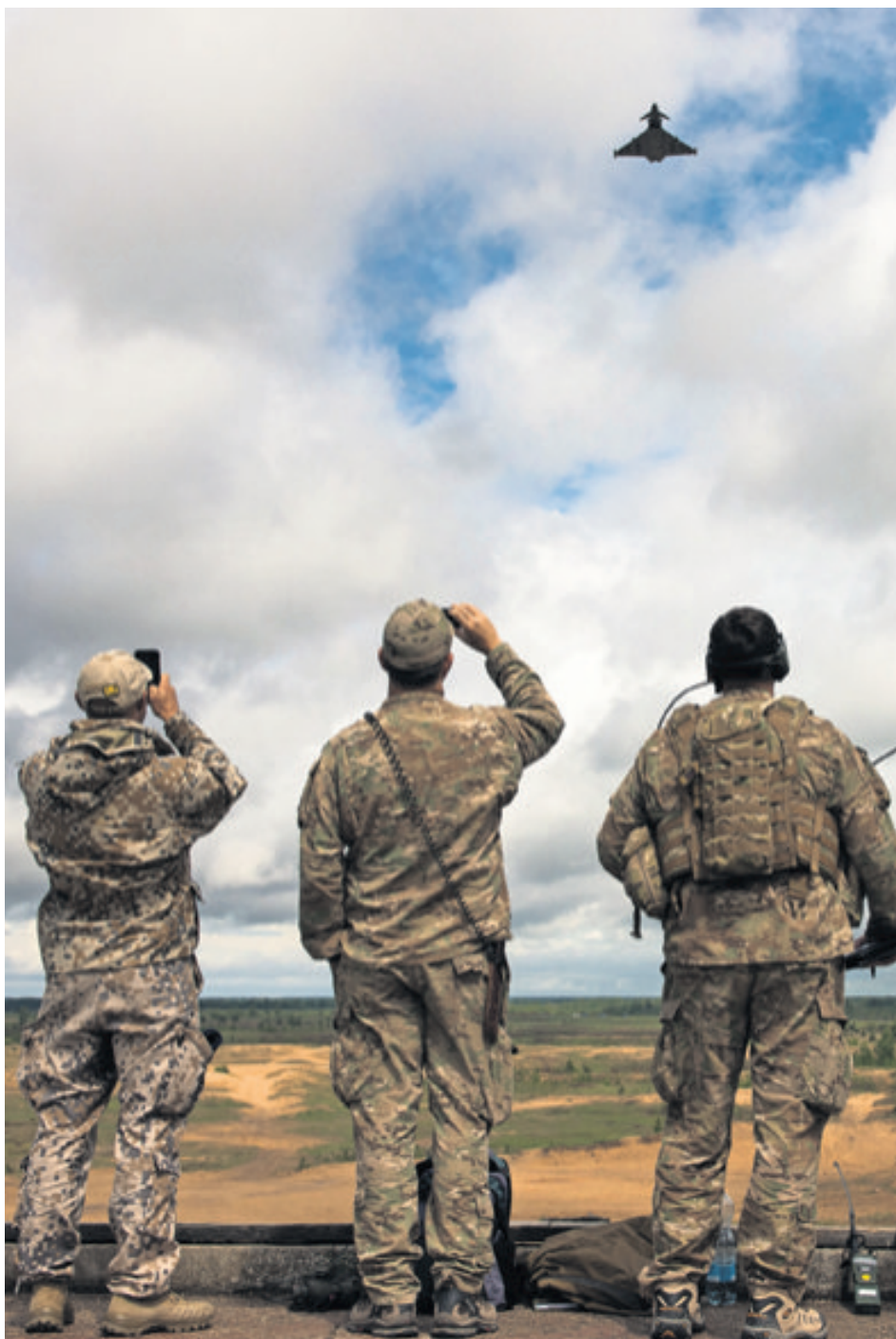
Amerikaanse en Letse militairen tijdens een demonstratie van Britse straaljagers bij Adazi, Letland. De demonstratie is onderdeel van het ‘Saber Strike’-trainingsprogramma waarbij Letland samenwerkt met Estland, Litouwen en de VS.

Gevoeligheid De Letten zijn het zat om ‘Oost-Europa’ te worden genoemd